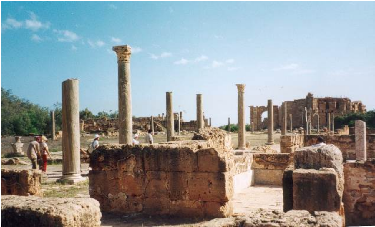
Si va alla Palestra .